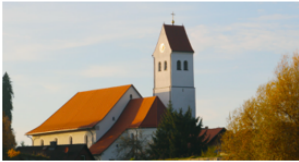
Pfarrei St. Georg Wohmbrechts